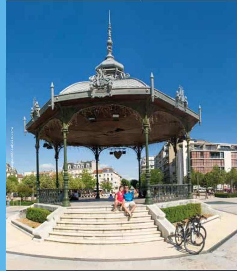
Les Cars de la Région Auvergne-Rhône-Alpes

Connectez vous et rejoignez le réseau des covoitureurs movici.auvergnerrhonealpes.fr