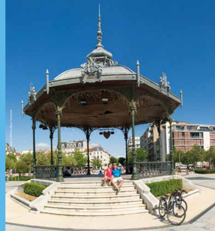
La Région vous transporte

N'oubliez pas de vous reporter aux renvois ci-dessous