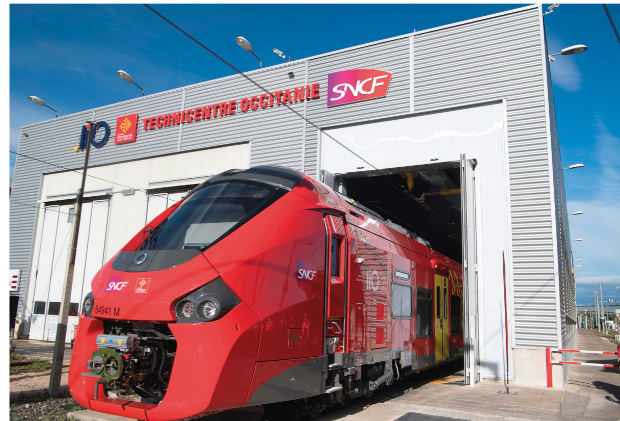
© Laurent Boutonnet - Région Occitanie. Cette nouvelle convention permettra à la Région de continuer à améliorer l'offre de service liO Train.