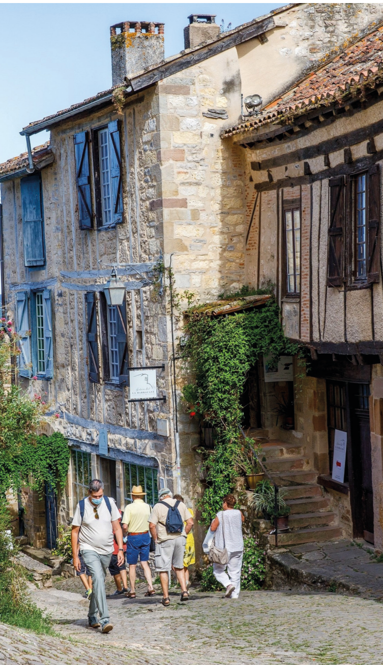
Arpentez le village de Cordes-sur-ciel, voyagez à travers le temps.

Art contemporain, Histoire, ce printemps, place à la culture avec liO. Le lien d'Occitanie vous propose une sélection de musées accessibles en train ou en car.