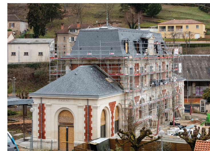
© Christophe Picci - ARAC. Reconstruction de la Gare de Figeac.

La Gare de Figeac, rachetée et reconstruite par la Région Occitanie après sa destruction par un incendie fin 2018, va rouvrir aux voyageurs et être inaugurée en juillet. Cette réouverture coïncidera avec le retour à Figeac des trains de et vers Toulouse, prolongés jusqu'à Aurillac.