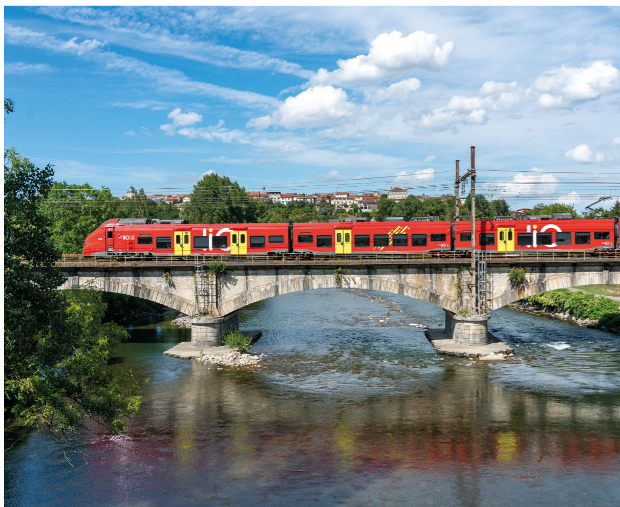
© Matthieu Chambraud - Région Occitanie. La Région Occitanie reconduit son marché avec SNCF Voyageurs jusqu'en 2032.

Cette nouvelle convention, votée en assemblée plénière du Conseil régional du 23 mars 2023, permettra à la Région de continuer à améliorer l'offre de service liO Train lors des dix prochaines années.