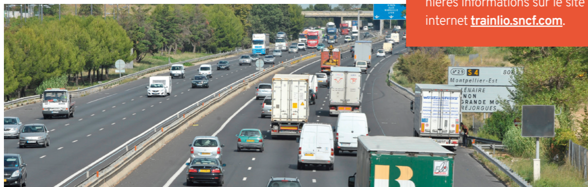
© Laurent Boutonnet - Région Occitanie. Les trains liO seront à 1€ sur la zone concernée par le pic de pollution persistant.

Les voyageurs peuvent solliciter le Centre Relation Clients liO Train au 0800 31 31 31 (service et appel gratuits), ainsi que les agents en gare, et peuvent retrouver les dernières informations sur le site internet trainlio.sncf.com .