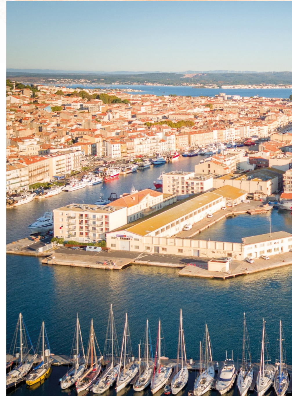
© Stintzy-Julien - Région Occitanie. Vue aérienne de la ville de Sète.

En autocar, avec les lignes 602 : Montpellier - Sète (2€) 659 : Pinet - Sète (2€) Ou en train, le CRAC se situe à 22 minutes à pieds de la gare.