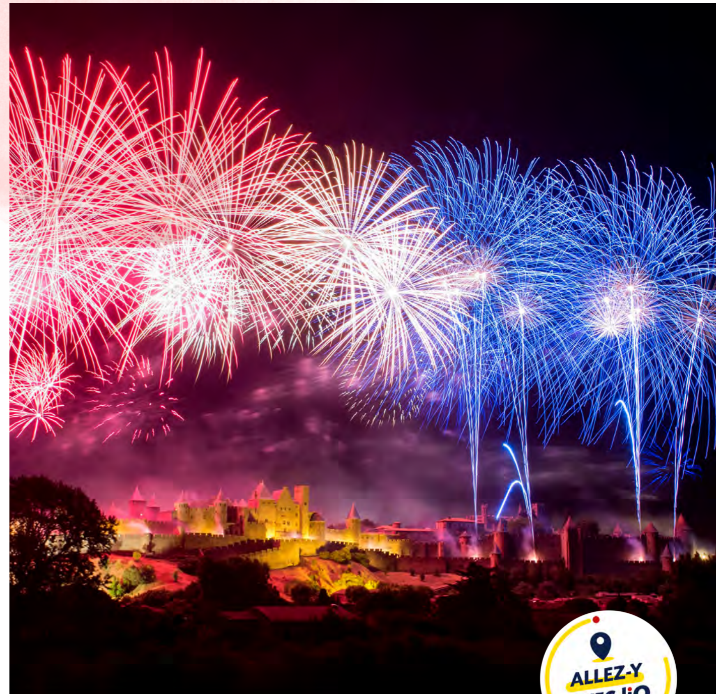
Embrasement de la Cité de Carcassonne

Des trains scolaires ont également été organisés, permettant à des lycéens de se rendre au Pont du Gard pour y visiter une exposition thématique.