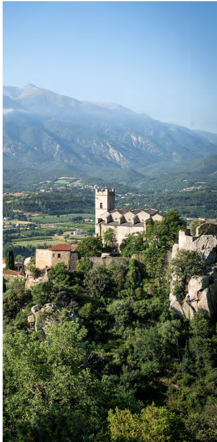
©Boutonnet Laurent - Région Occitanie. Découvrez le village de Eus, face au Canigou.