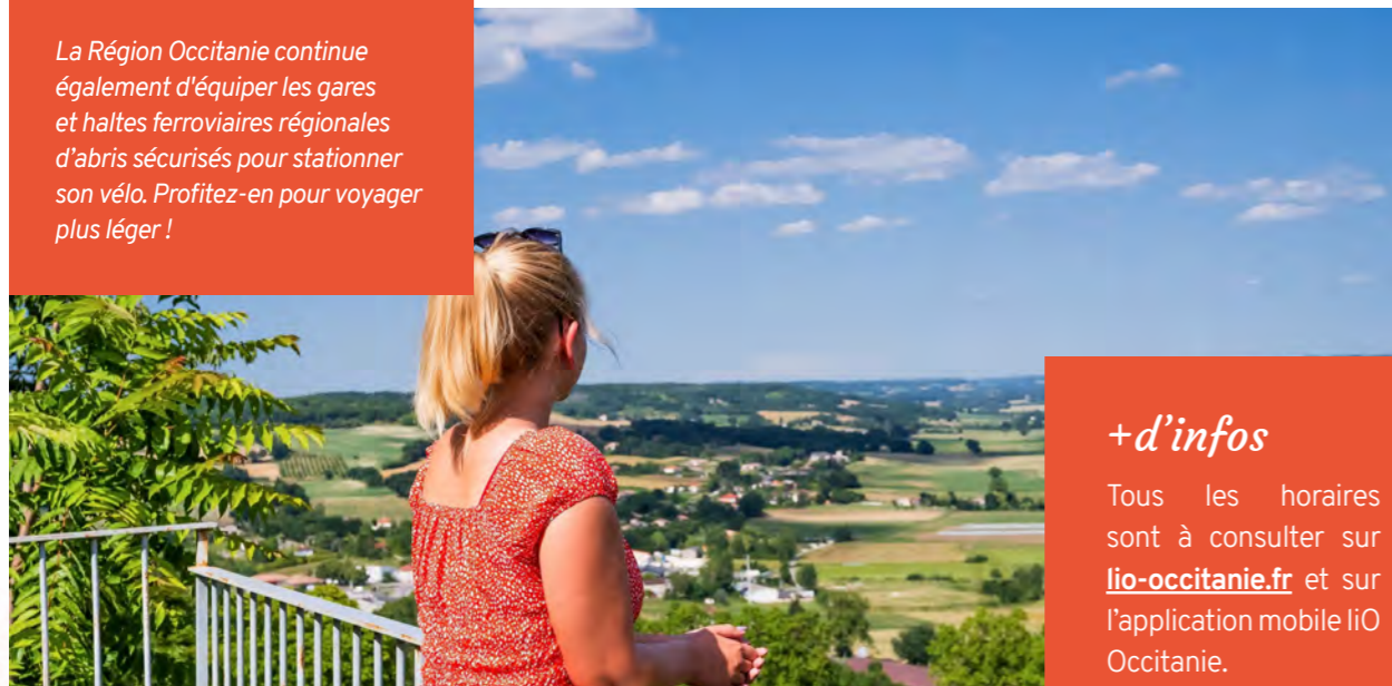
Le Jardin du Pèlerin à Lauzerte (82), juin 2021.