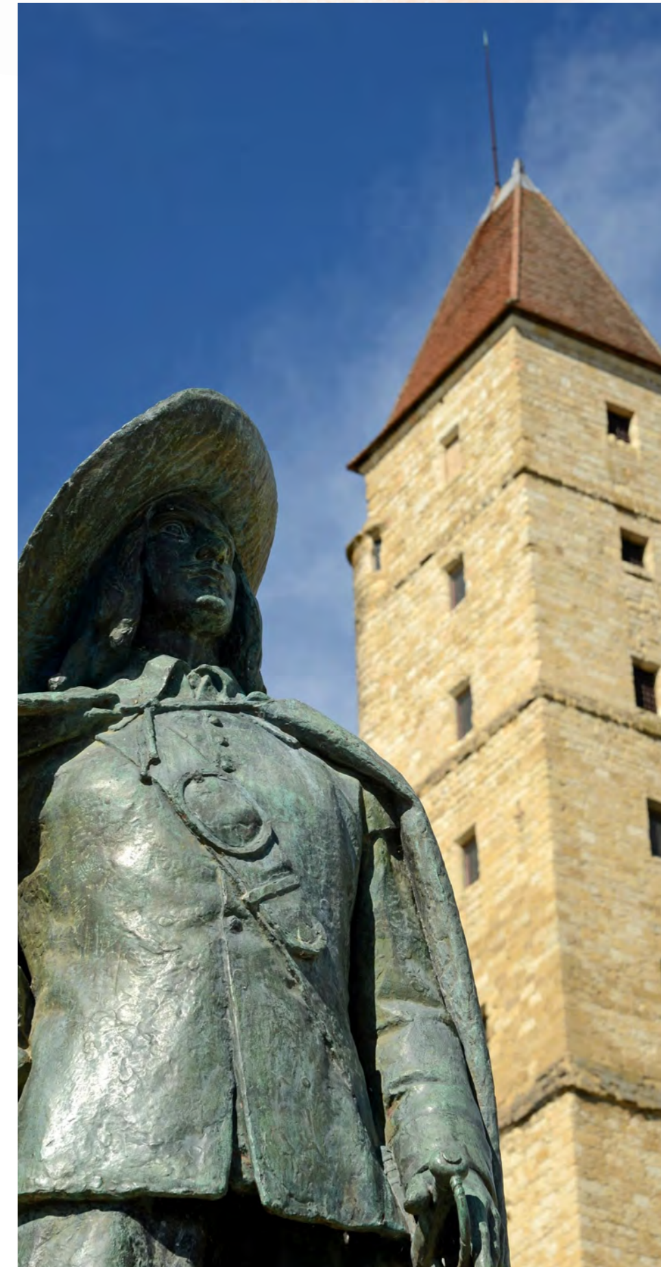
La Tour d'Armagnac dominant la statue de d'Artagnan à Auch.