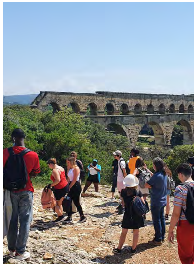
Sortie scolaire Pont du Gard

A vec 17 trains événementiels organisés, l'année 2022 a représenté un millésime riche et équilibré. Comptabilisant plus de 11 600 billets vendus, cette édition a connu un beau succès et les trains événementiels liO ont rencontré leurs publics. Quelques uns de ces trains ont servi de locomotives à cette édition, comme ceux organisés dans le cadre d'Escale à Sète, de l'embrasement de la Cité de Carcassonne ou des Feux de Collioure. Mais des opérations moins « grand public », plus ciblées, ont néanmoins fait carton plein. On peut citer parmi ces initiatives sortant un peu des sentiers battus, le « train des viaducs de l'extrême », ou le « train Théâtre », offrant une dimension plus patrimoniale ou culturelle à leurs voyageurs.