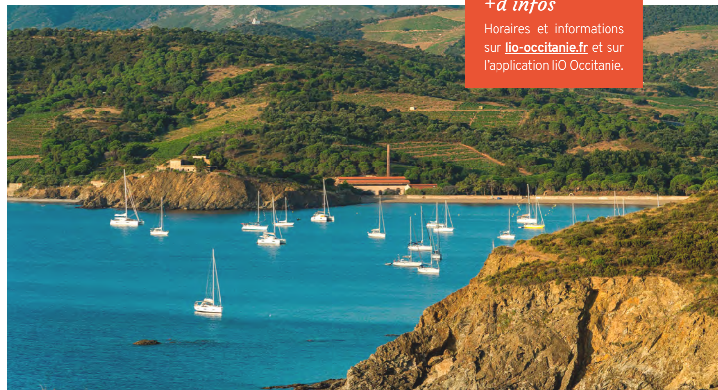
©Romain Saada - Région Occitanie. Nouveau pass 3€ pour se rendre sur la Côte Vermeille en train ou en car liO.

Horaires et informations sur lio-occitanie.fr et sur l'application liO Occitanie.