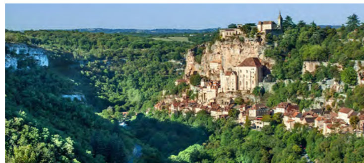
Rocamadour

Pour accompagner la montée en puissance de l'Occitanie Rail Tour, et pour inspirer vos voyages, un guide Michelin baptisé « l'Occitanie en train » a été spécialement édité. Il est d'ores et déjà disponible en librairie, en deux langues (français et anglais) au tarif de 21,90 €.