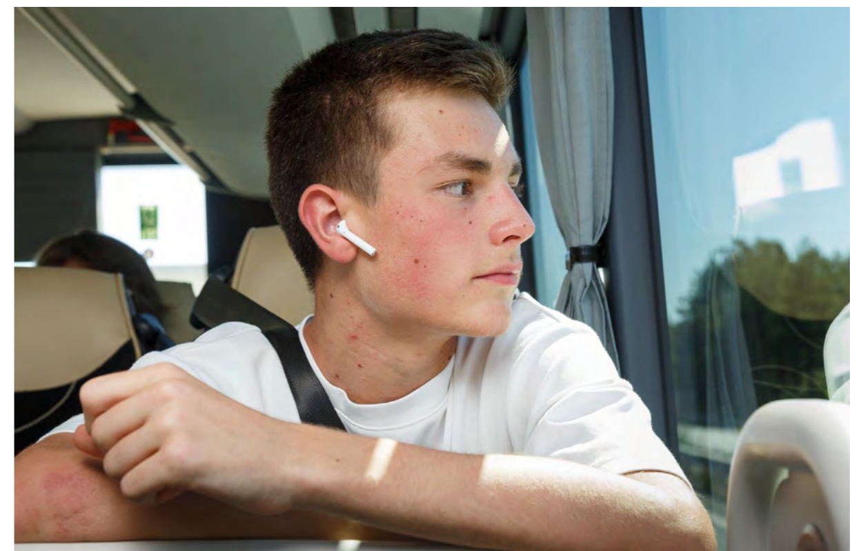
© Romain Saada - Région Occitanie. Les inscriptions au transport scolaire régional sont ouvertes jusqu'au 31 juillet 2023.