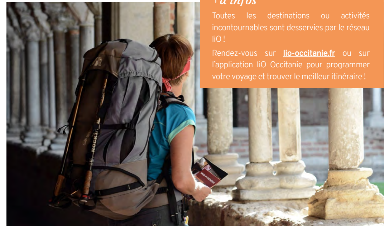
Cloître de l'Abbaye Saint Jacques de Moissac (82) - Sur les chemins de St Jacques de Compostelle

Rendez-vous sur liO-occitanie.fr ou sur l'application liO Occitanie pour programmer votre voyage et trouver le meilleur itinéraire !