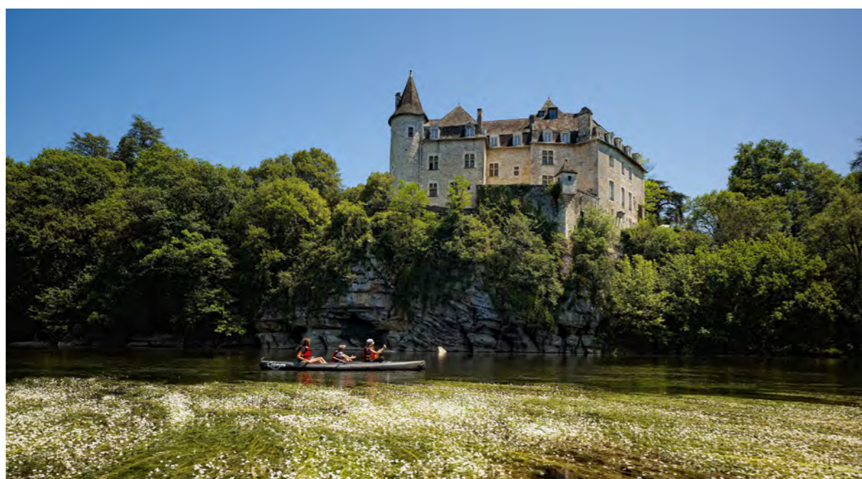
Dordogne.

De Rocamadour, vous gagnerez la vallée de la Dordogne lotoise en autocar liO via Souillac. Une descente en canoë sur la rivière espérance s’impose ! Puis vous prendrez le train pour Cahors afin d’y admirer le Pont Valentré (UNESCO) ainsi que les quartiers médiévaux dominés par la cathédrale Saint-Étienne aux coupes byzantines si particulières. S’il vous reste assez de temps, optez pour une mini-croisière fluviale sur le Lot. Émerveillement assuré ! Il vous restera juste à rejoindre la gare et, 1h30 plus tard vous voilà arrivés à Toulouse, au terme de votre périple à travers la campagne d’Occitanie.