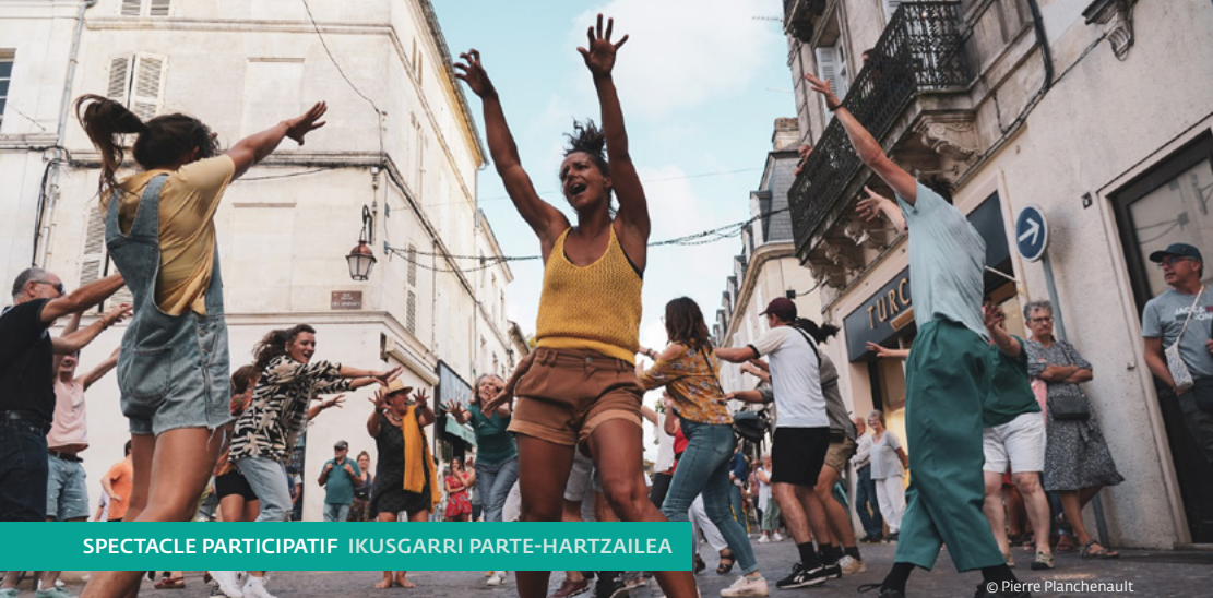
SPECTACLE PARTICIPATIF IKUSGARRI PARTE-HARTZAILEA