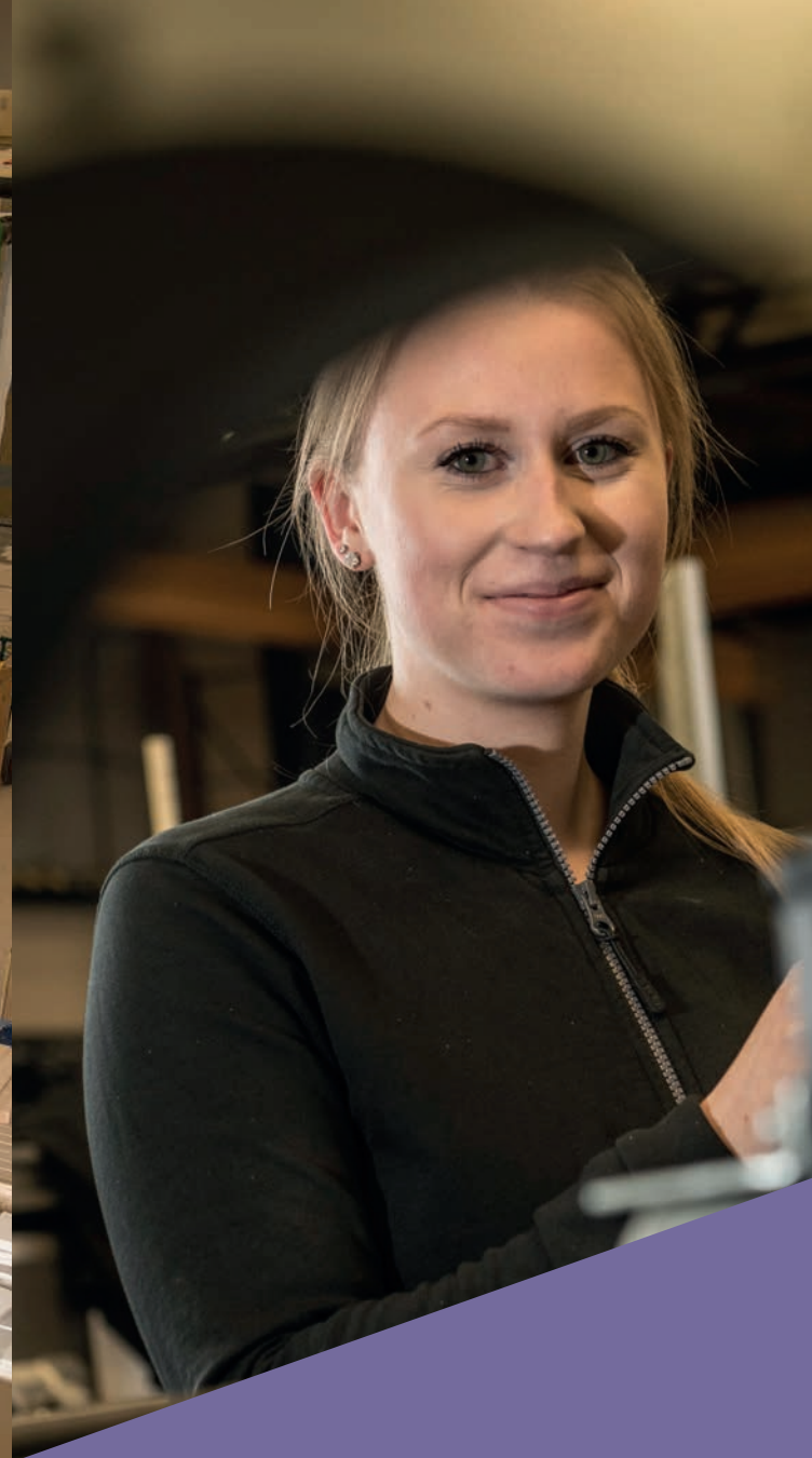
Ovan: Svalson, Piteå Vänster: Lindbäcks Bygg, Piteå