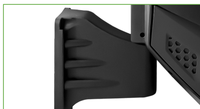
CON STAFFA A PARETE