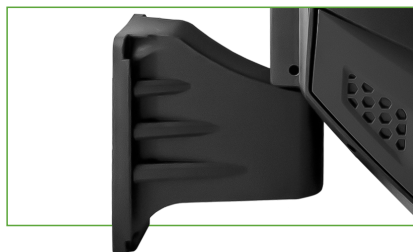
CON SOPORTE DE PARED