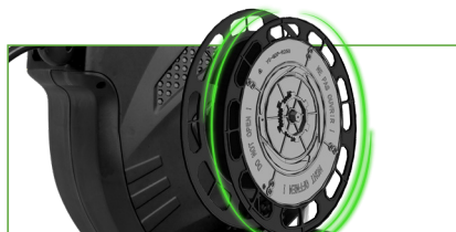
CON SISTEMA DE REBOBINADO