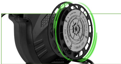
MIT AUTOMATISCHE FÜHRUNG