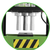
PISTONE CON SPOSTAMENTO ORIZZONTALE