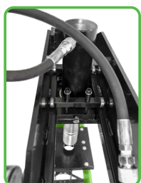
PISTONE CON SPOSTAMENTO ORIZZONTALE