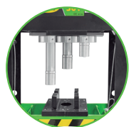
PISTONE CON SPOSTAMENTO ORIZZONTALE