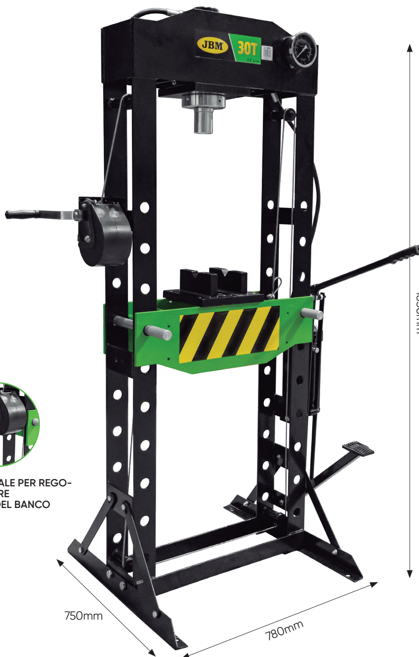
MANUALE E A PEDALE