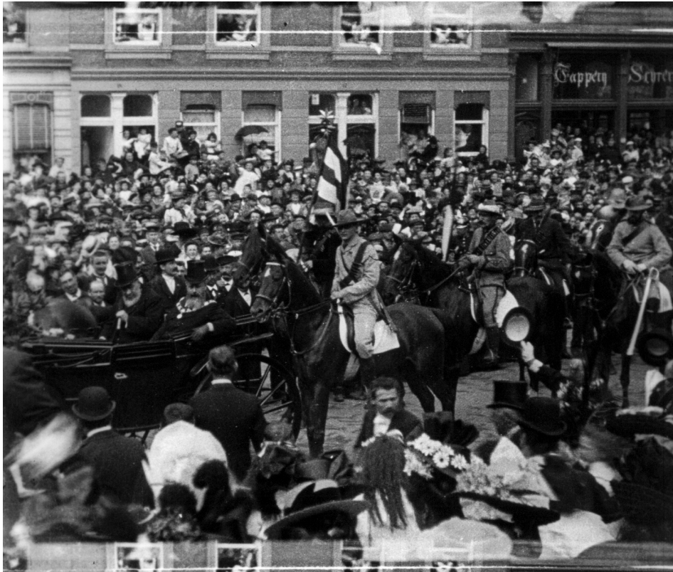
Paul Krüger op het Vredenoordplein te Rotterdam, 26 juni 1901