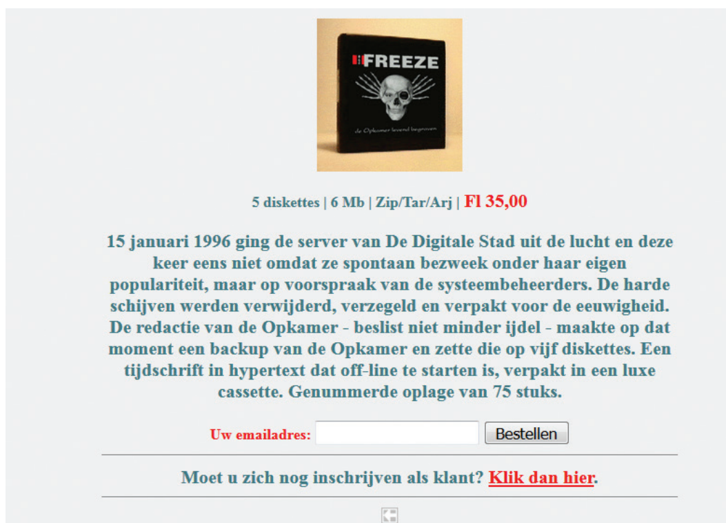
Afbeelding 6. Tweede gearchiveerde versie als verzamelobject aangeboden in de webwinkel.

Na deze digitale ontdekking nam ik begin 2018 vol spanning contact op met de heer Van der Kamp. De floppy uit de webshop kon een unieke aanwinst voor de born digital collectie van de KB zijn en wellicht ooit in de expositie topstukken kunnen worden tentoongesteld als tastbare, zichtbare en authentieke drager van een webincunabel. Na digitaal en telefonisch contact was de gevraagde floppy nog niet ter sprake gekomen, maar was de webmaster wel – zonder dat ons te laten weten – weer begonnen met het maken van een reconstructie van de oude site op een nieuwe URL: opkamer.org.