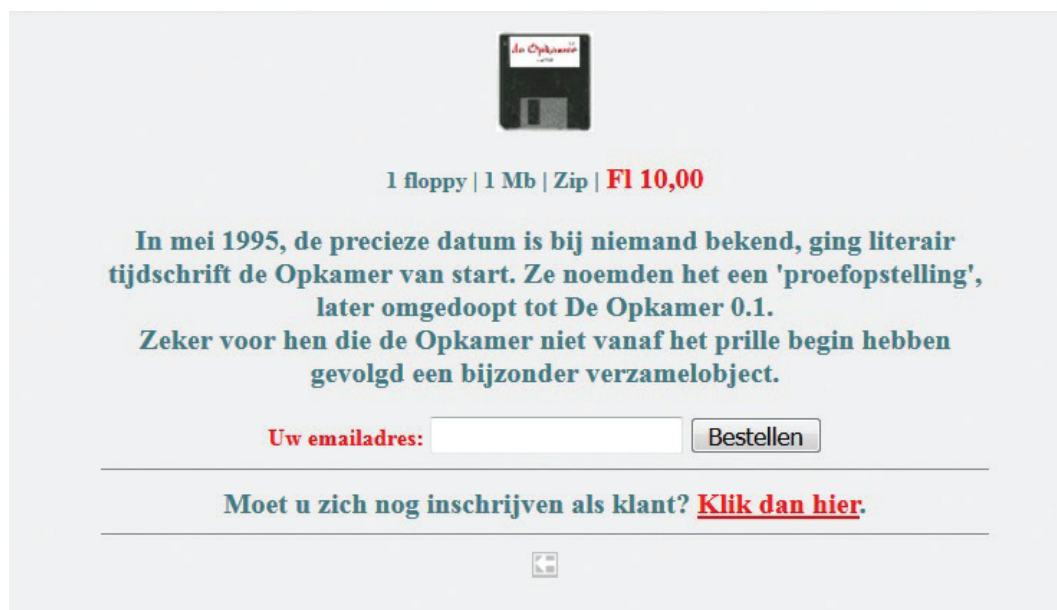
Afbeelding 5. De gearchiveerde versie als verzamelobject aangeboden in de webwinkel.

Daar het oudste webarchief van Nederland genaamd Archipol van het Documentatiecentrum Nederlandse Politieke Partijen (DNPP) pas in 2000 begon met archiveren en de eerder genoemde DDS-freeze uit 1996 dateert, zou deze gearchiveerde versie van de site uit 1995 wel eens het oudste webarchief van een Nederlandse site kunnen zijn.