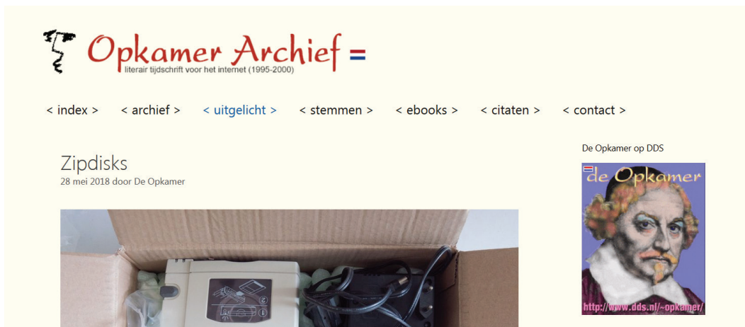
Afbeelding 8. Screenshot van blog op website De Opkamer.

bestaan te hebben geleid en nooit de diskdrive te hebben verlaten. Daar er nooit een online bestelling was geplaatst, was het aangekondigde archief uiteindelijk nooit fysiek verschenen. De data (uit 1995) was gelukkig wel bewaard gebleven in de collectie van de maker. 26 De gereconstrueerde versie van de site uit 2018 is uiteindelijk 23 jaar later het beloofde unieke verzamelobject geworden, 'zeker voor mensen die de Opkamer vanaf het begin niet hebben gevolgd', zoals de verkooptekst uit de jaren '90 luidde. 27 De KB heeft de archiefversie niet gekregen in de vorm van een floppy, maar probeert wel de bestanden alsnog van oude datadragers af te halen. Bovendien archiveert de KB de gereconstrueerde versie van de site met de contextinformatie die door de heer Van der Kamp is toegevoegd.