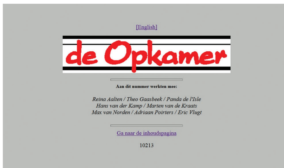
Afbeelding 2. Screenshot van één van de eerste edities van De Opkamer in 1995.

De oorspronkelijke maker van deze site, Van der Kamp, ging steeds meer gebruik maken van de mogelijkheden die html-code bood voor de opmaak, indeling en inhoud. Doordat de technische mogelijkheden niet meer werden beperkt door papier, inkt en prijzige analoge ontwerp- en druktechnieken, kon worden geëxperimenteerd met frequentere verschijningen (bijvoorbeeld het citaat van de dag), audio ('het stemmenkabinet', met geluidsopnames van gesproken fragmenten door auteurs zelf) al dan niet bewerkte foto's en bewegende afbeeldingen, kleur en digitale vormgeving. Daarnaast was het spel met virtuele auteurs waarvan de lezer niet geheel duidelijk was of het persoon ook IRL (in real life) bestond of dat de maker van het tijdschrift zich achter verschillende virtuele personen verschuilde (met een eigen digitaal portret), een spannend en verfrissende nieuwe manier om met pseudoniemen, identiteiten en authenticiteit om te gaan. 8