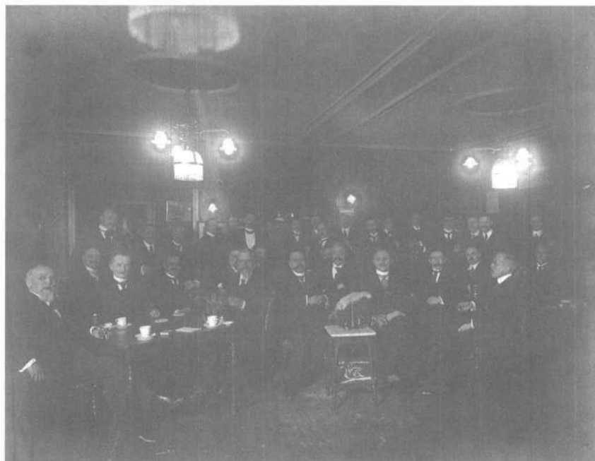
Gezelligheid van heren met gevoel voor stijl en verantwoordelijkheid. Opening van de Haagse Journalisten Sociëteit op 10 maart 1916.