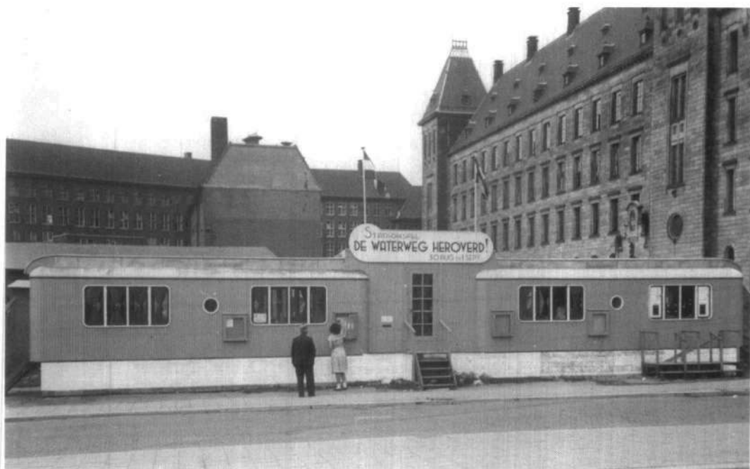
Bevrijdingsspel 1947. Voor de organisatie en kaartverkoop bouwde Briels een tijdelijk paviljoen achter het stadhuis van Rotterdam

waar geslaagd, hetgeen betekende dat Nederland er een nieuwe levensvorm bij gekregen had. Maar de uitwerking was, hoezeer ook 'bevredigend', toch niet helemaal geruststellend. Er moest, zo vond Vrij Nederland , naar een steeds 'inhoudrijkere' en 'zinrijkere' uitbeelding gestreefd worden. 14