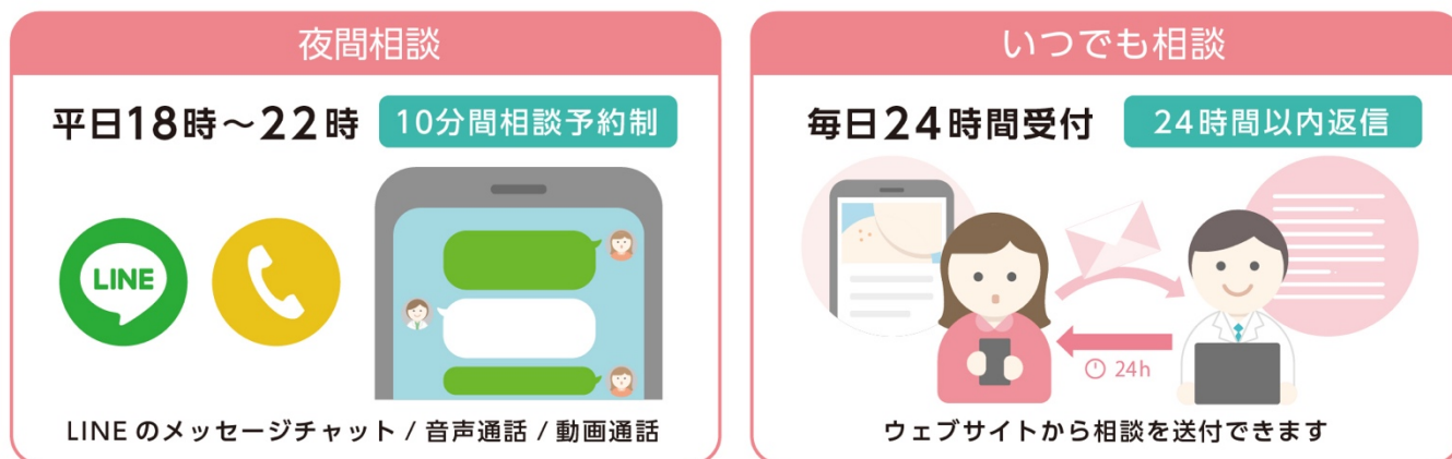
「夜間相談」と「いつでも相談」のサービスイメージ