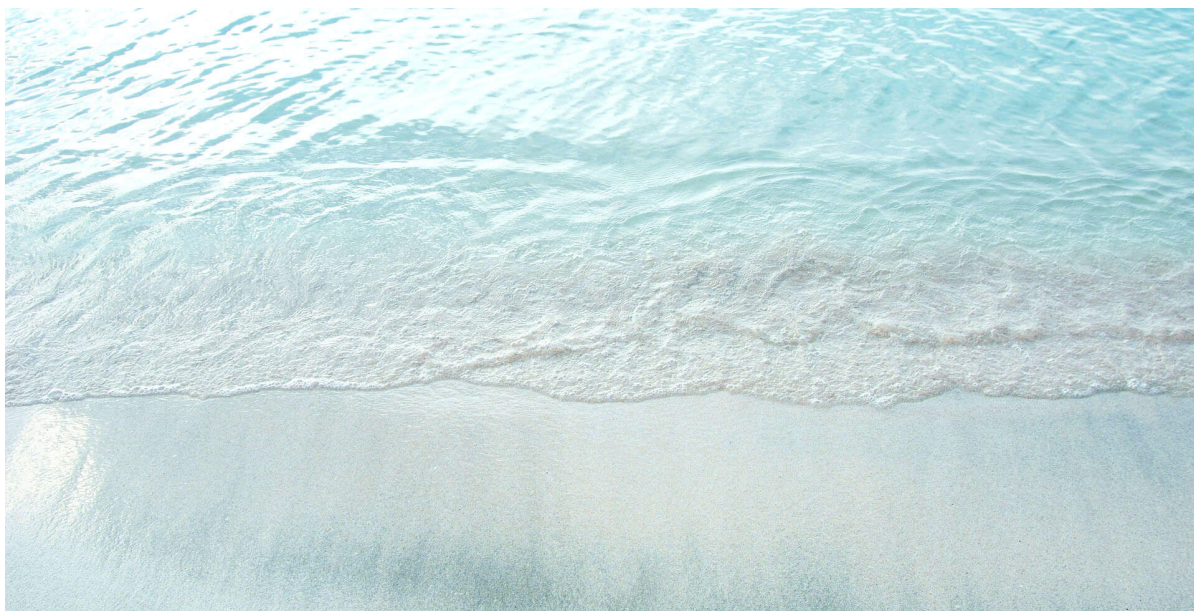
眩しいほどに透き通る、若狭和田ビーチの水