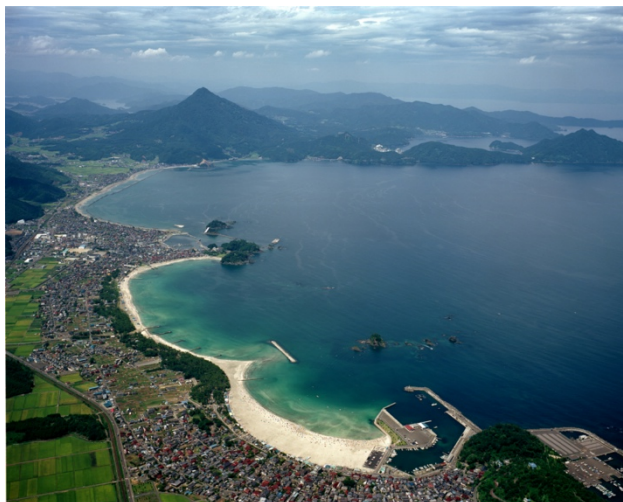
高浜町を空から臨む

24時間対応の医療・育児相談をご提供することで、平日に町の施設に来所できない方への対応や、夜間や休日の育児相談のより一層の充実につながるよう、オンライン健康医療相談で貢献してまいります。