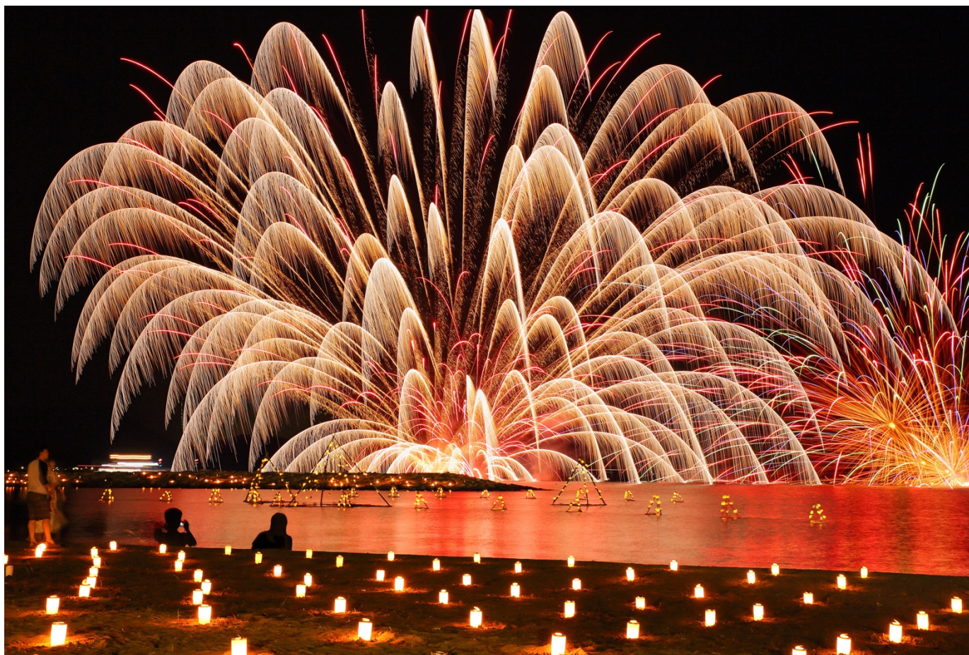
2022年に優秀の美を飾った「若狹たかはま漁火想」

この度、高浜町では、休日や夜間でも対応できる専門医や助産師によるオンライン相談の試験運用を実施することとなりました。子育て世帯の不安や悩みに寄り添うことでさらなる子育て環境の充実を図ってまいります。お気軽にご利用ください。