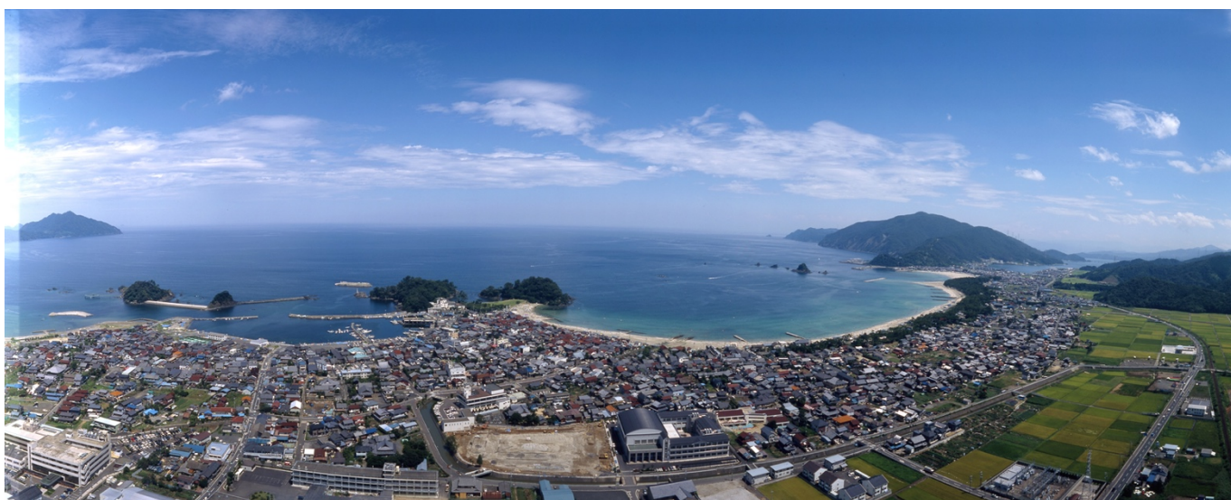
美しい海水浴場を有する海岸線