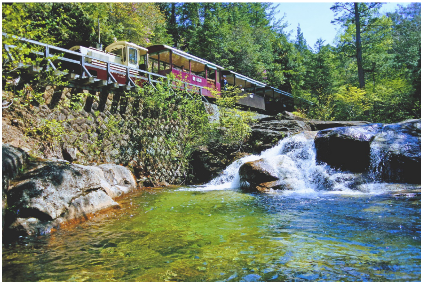
赤沢自然休養林の美しい景観を走る「赤沢森林鉄道」