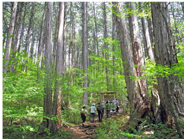
樹齢300年以上の天然木曽ヒノキが林立する「赤沢自然休養林」

上松町では母子保健事業や子育て支援、児童福祉事業に力を入れていらっしゃいます。育児相談や発育発達相談を丁寧に実施しているほか、さまざまな助成制度も充実させているとのことでした。