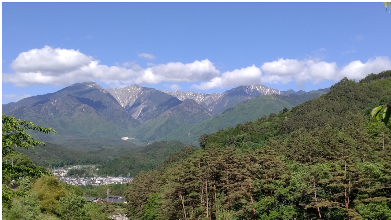
雄大な中央アルプス「木曾駒ヶ岳」