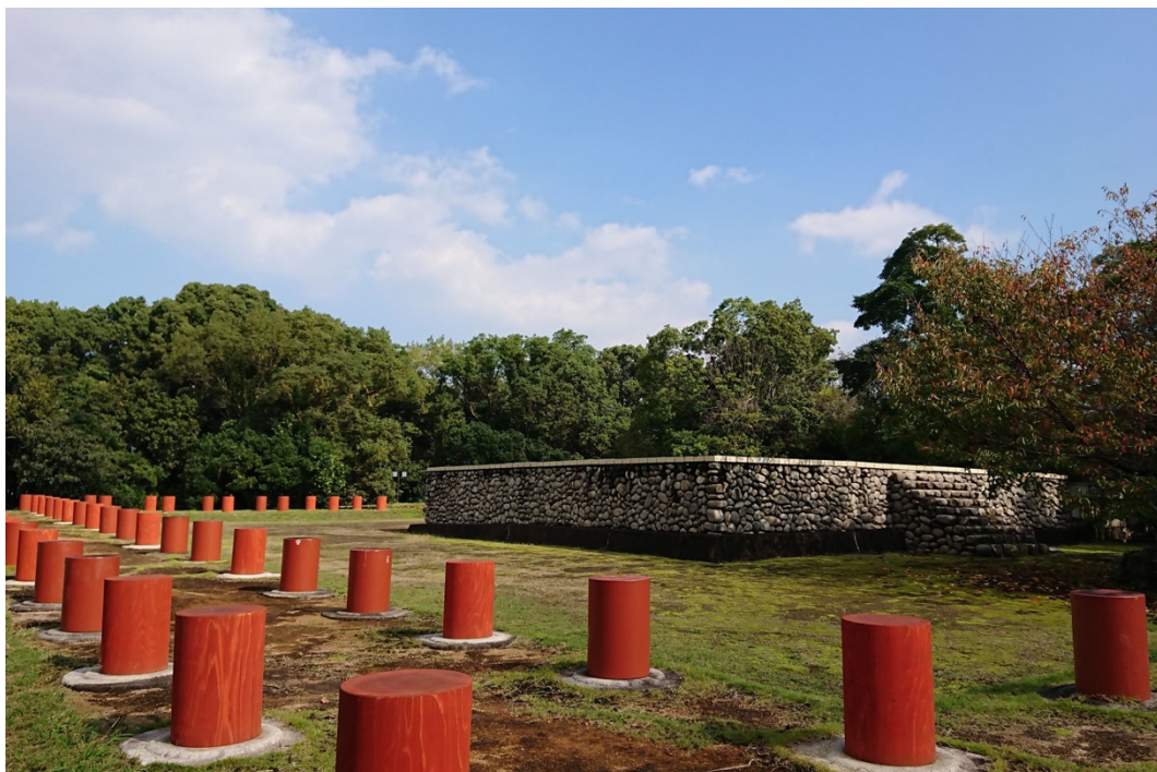
国史跡 古代寺院 海会寺跡

妊産婦、子育て世代へのきめ細かな支援に取り組むために、本実証実験を通して、妊産婦、子育て世代のニーズに対応した支援のあり方を検討し、子育て世代の方々を積極的にサポートしながら、子どもと大人が、夢や希望を持ち、ともに健康に成長できるよう、妊娠期から子育て期における切れ目のない支援体制の充実を図ります。