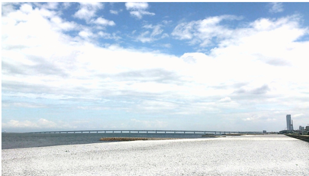
白い大理石が敷き詰められた 泉南マーブルビーチ