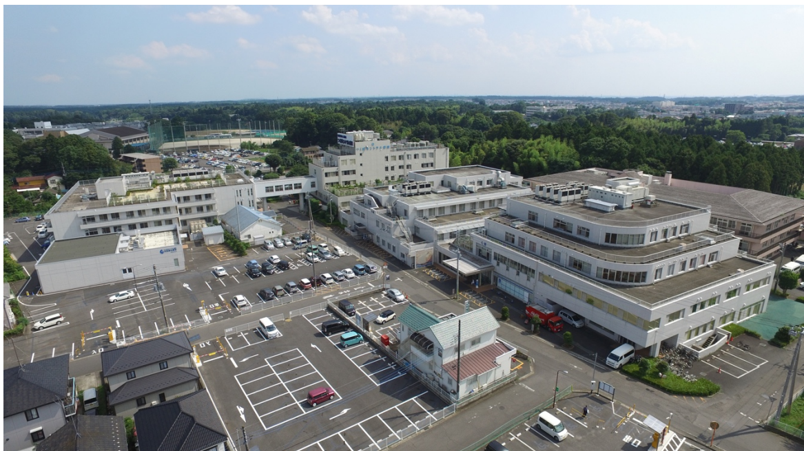
上空からつくばセントラル病院を望む

今後も地域に根ざした医療を大切にし、安心して子育てができる環境づくりを進めてまいります。