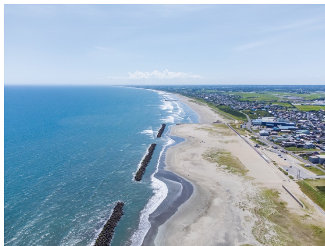
美しい九十九里浜の海岸線

千葉県の北東部に位置する旭市は、都心から約80km圏内に広がるまちです。南は九十九里浜の雄大な海岸線に面し、北部はなだらかな丘陵地で「干潟八万石」と呼ばれる広大な穀倉地帯が続き、温暖な海洋性気候に恵まれています。この豊かな自然を背景に、全国有数の産出額を誇る農業や畜産業、飯岡漁港を拠点とする漁業が盛んに行われ、首都圏の食料供給を担う重要な地域となっています。また、九十九里浜を一望する刑部岬からの眺めは「日本の夕陽百選」「日本の夜景百選」にも選ばれており、その美しい景観は多くの人々を魅了します。