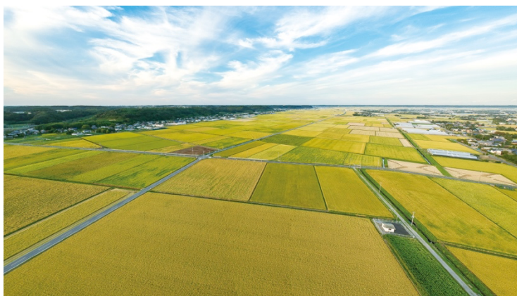
千漣八万石を望む

いつでもどこからでも気軽に相談できる環境を整えることで、旭市における妊娠・出産・子育て支援のさらなる充実に貢献してまいります。