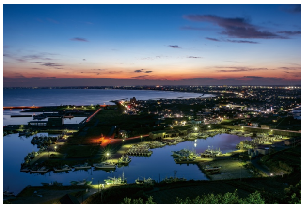
「日本の夜景100選」にも選ばれた刑部岬の夜景