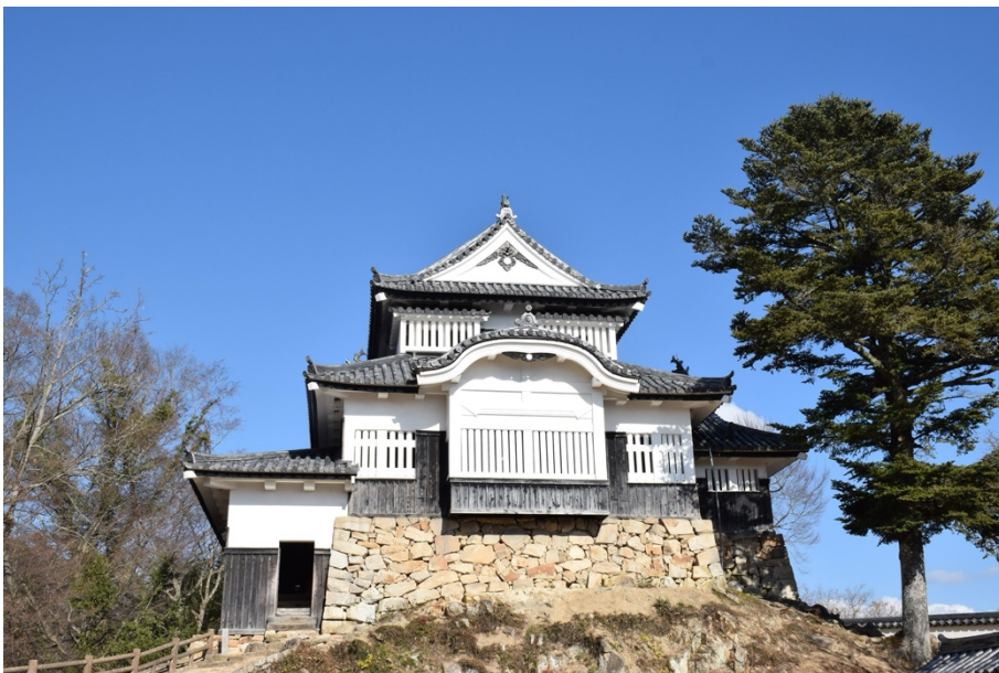
「天空の山城」とも呼ばれる備中松山城

この度、妊娠・出産・子育て支援体制の強化と、安心して子どもを産み育てられるまちづくりの一層の推進のため、オンライン健康医療相談窓口として『産婦人科・小児科オンライン』を導入いただきました。いつでもどこからでも気軽に産婦人科医・助産師・小児科医に相談できる環境を整えることで、高梁市におけるさらなる妊娠・出産・子育て支援の充実に貢献してまいります。