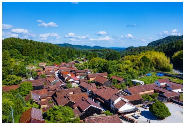
赤く彩られた吹屋の町並み