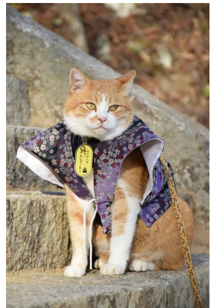
猫城主さんじゅーろー