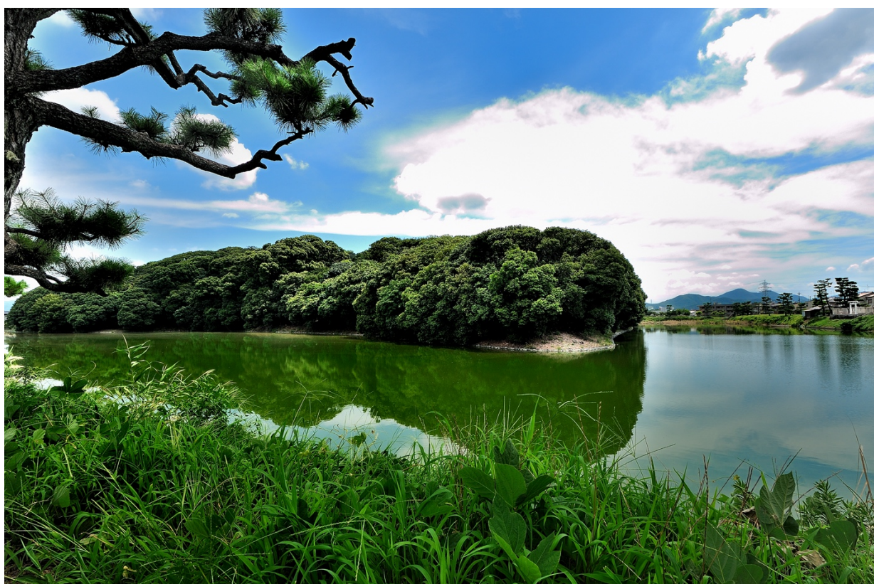
周濠にはたくさんの水鳥が飛来する仲哀天皇陵古墳

産婦人科オンライン ( https://obstetrics.jp/ )、小児科オンライン ( https://syounika.jp/ ) は、産婦人科医、小児科医、助産師にスマホから相談できるサービスです。平日 18 時～22 時の間、10 分間の予約制で相談できる「夜間相談」と、毎日 24 時間メッセージを送れる一問一答形式のサービス「いつでも相談」の 2 つの形式で相談に対応しています。「子どもの湿疹のケアについて」「月経前のイライラがひどい。対処法は?」「夜から発熱。受診すべき?」など何でも気軽に専門家へご相談いただくことが可能です。