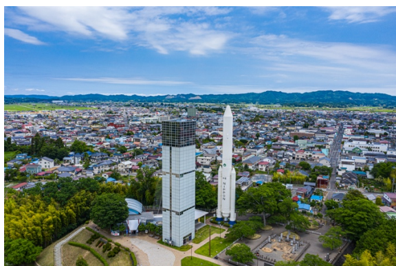
角田市 市街地を臨む

妊産婦と小さい子どもを抱える家庭が安心して医療にかかれるよう、市として対策を講じることは課題としてあがっており、専門の医療機関の誘致を続けてきましたが難航しておりました。