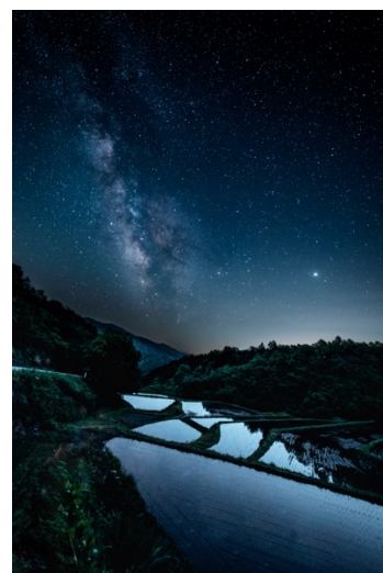
丸森町 沢尻の棚田の風景

一方で、町内に産婦人科や小児科のある医療機関がなく、病院受診に時間を要している状況にあります。そこで今回、各ご家庭のスマートフォンやタブレット端末を用いて医療者に相談ができる「産婦人科オンライン」「小児科オンライン」が採用され、2022年4月からの本導入を目指して無料トライアルが実施されることになりました。