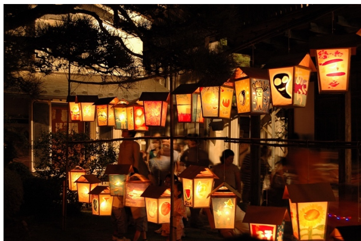
「齋理幻夜」約 1,000 基の絵とうろうの灯り