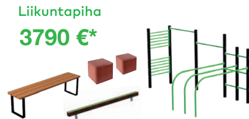
Liikuntapiha 3790 €*

* Hintoihin lisätään alv sekä toimituskulut.