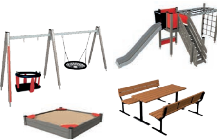
Ison pihan suosikit 7390 €*