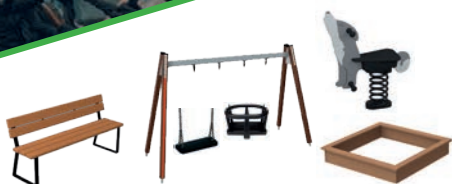
Pihan suosikit 1 1990 €*