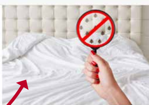
Isännöitsijätodituksen maininta teoisesta asunnosta ja rapussa tehdystä tuholaiсторjunnasta on vaikuttanut asuntokauppaa heinäkuussa Helsingin Sanomat.

Panoraama 980 x 120 px (näky etusivulla)