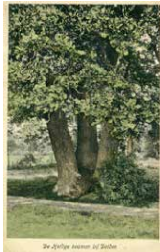
De Heilige boom van Delden

lig is van alle tijden en van alle volken. Voor de komst van het christendom, koos men die plekken in de natuur. Bijvoorbeeld op een verhoging in het landschap, of – je raadt het al – bij een indrukwekkende boom. Hier