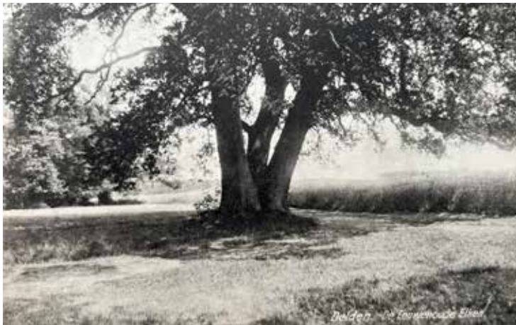
Delden - de Deldeneresch Eiken

kwam men samen om de goden te vereren, te bidden of een offer te brengen. Bij zo’n boomheiligdom konden ook belangrijke bijeenkomsten plaatsvinden, zoals rechtspraak. In Europa waren het de Kelten en Germanen die rond het begin van onze jaartelling heilige bomen kozen om hun rituelen uit te voeren. Vooral de eik en de linde werden als heilig bestempeld. Wellicht gebeurde dat ook hier op de Deldeneresch. Een toeristische gids uit 1910 verhaalt over: ‘(...) breedgetakte eiken, de zogenaamde heilige eiken. Het zijn zeer zware boomen, één van dezen aan zijn voet reeds in drieënorsch uitlopende, vormt al ’t ware een stoel. De overlevering zegt dat hij in den Lebuïentijd als predikstoel werd gebruikt.’ Lebuïnus was een missionaris uit de achtste eeuw die de opdracht kreeg om onder andere Overijssel te kerstenen. Met de