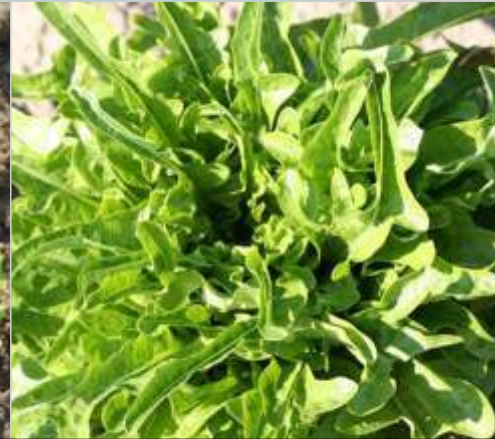
'Cressonnette du Maroc'