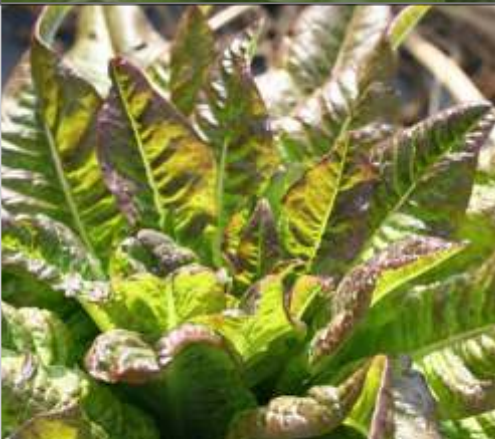
'Oreille du diable'