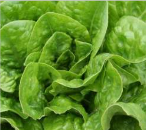
'Chicon du Père Vendi'