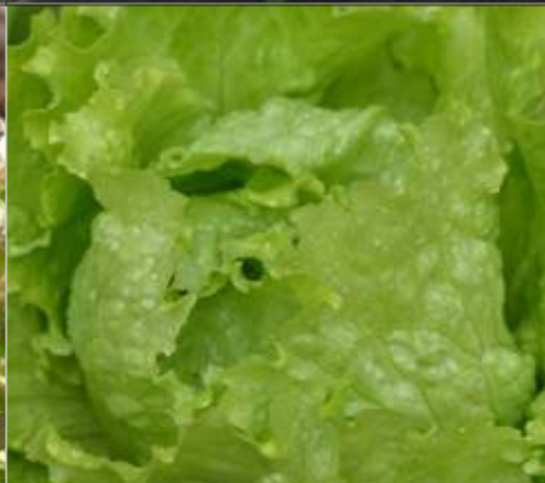
'Dorée de printemps'