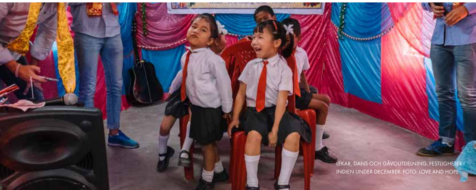
LEKAR, DANS OCH GÅVOUTDELNING. FESTLIGHETER I INDIEN UNDER DECEMBER.