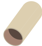
un rouleau de papier toilette (facultatif)