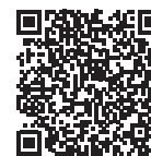
micro Rhombus PL

In den Kellermann micro Rhombus PL ist, wie schon bei den Kellermann micro Rhombus LED Blinkern, die bewährte Long Life Protection Guard Schaltung® integriert. Diese sorgt in Verbindung mit den Hochleistungs-Marken-LEDs für eine extrem hohe Lebensdauer. Ein Auswechseln des Leuchtmittels ist somit nicht erforderlich und aus zulassungstechnischen Gründen auch nicht möglich.