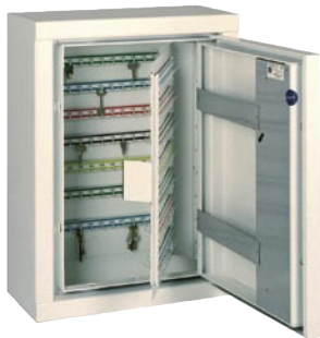
SÄK 210- Nyckelsäkerhetsskåp med 210 justerbara krok.

Skåpen kan inredas med olika typer av inredning t.ex hyllplan, mapphängare, låsbara fack eller nyckelinredning upp till över 3000 krok. Fastighetsbolag, bilföretag, hemtjänst är exempel på användare.