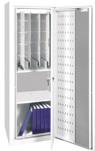
SÄK 1500 LK- Säkerhetsskåp 1500, nyckelinredning 140 långa krok, hyllplan samt nyckelinsats i dörr om 218 krok.