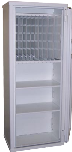
SÄK 1900- Säkerhetsskåp 1900, utdragbara nyckelskivor om 1077 krok samt hyllplan.