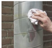
Rengör och avfetta