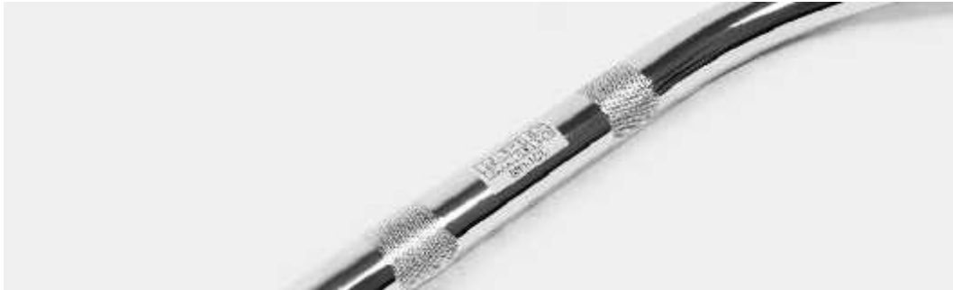
Art der Kennzeichnung