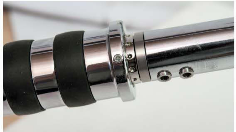
18 Die Klemmschrauben des Zubehör-Griffes werden an den vorgegebenen Bohrungen am Handgriff ausgerichtet

Nun werden die Fixierschrauben mit Schraubensicherung (Loctite o. Ä.) versehen und dann mit einem Drehmoment von 8 Nm angezogen. Die Bowdenzug-Litze wird vom Vergaser aus verlegt und sollte nicht mit zusätzlichen Schmiermitteln (Fett/Öl) versehen werden. Die Seilklemmer werden nun in das Griffstück geschoben und die Litze eingeführt. Auf der Seite der Seilklemmung wird die mitgelieferte Sonderschraube mit Kugellagern und Distanzscheibe montiert. Anschließend wird der Bowdenzug am Vergaser eingehängt und das Zugseil mit den Madenschrauben so fixiert, dass die Kugellager ein Axial-Spiel von ca. 0,5 mm haben. Nun wird die Sonderschraube mit den Kugellagern wieder vom Laufwagen demontiert und der Zug am Vergaser wieder eingehängt. Jetzt kann der Zugschlitten bis an das Ende gezogen werden um das überlange Seil einzukürzen. Anschließend kann das Seil wieder am Vergaser eingehängt werden.