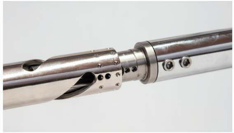
16 Der Handdrehgriff wird aufgeschoben