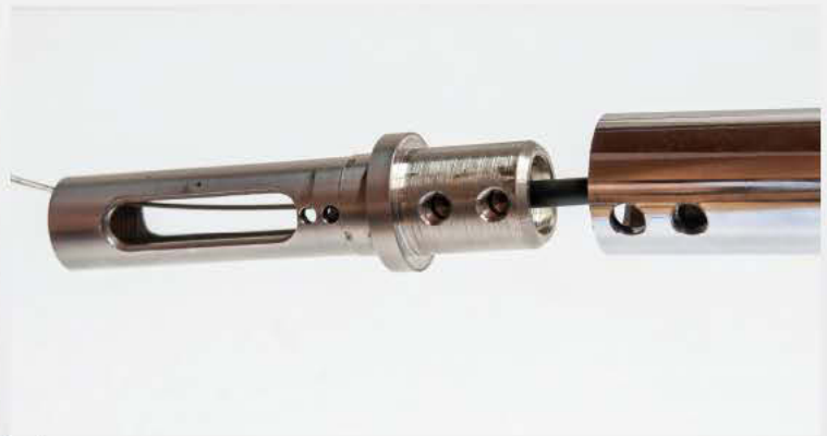
12 Die Bowdenzug-Außenhülle muss bis zum Anschlag in das Griffstück geführt werden