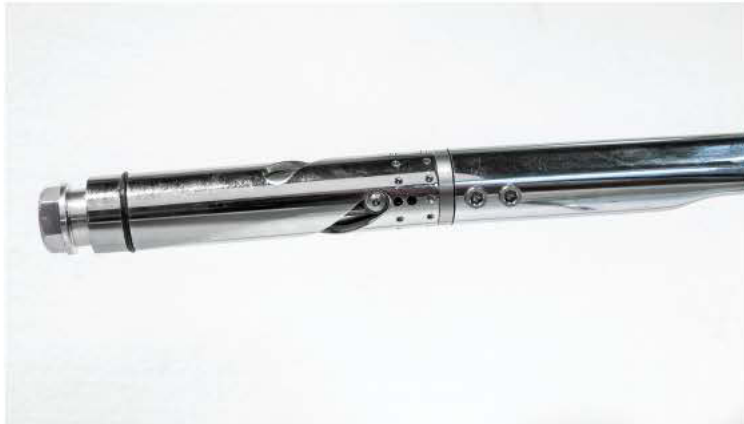
17 Die Lagerbundschrabe verschleißt den Gasgriff