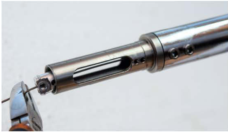
15 Das Zugseil wird gekürzt