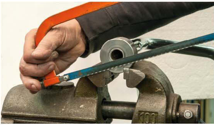
7 Das Lenkrohr sollte möglichst grade abgetrennt werden