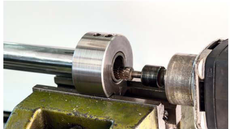
10 Das Lenkrohr sollte sorgfältig entgratet und Schweißraupen entfernt werden

Jetzt kann die Außenhülle des Bowdenzuges bis zum Anschlag in das Griffstück geschoben und der Zug verlegt werden.