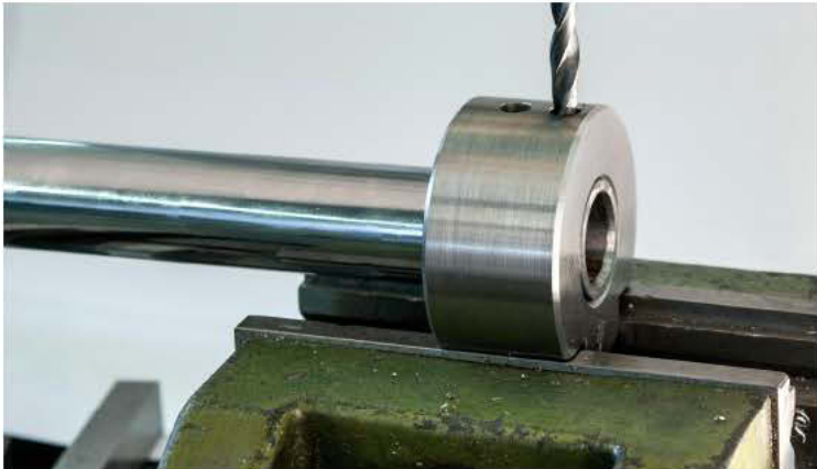
9 Mit der optionalen Bohrlehre können die Löcher einfach positioniert werden