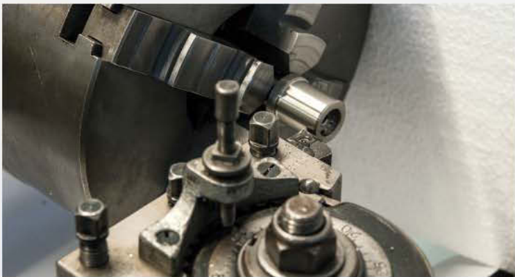
11 Eventuell muss das Griffstück dem Lenkrohr angepasst werden

Lenker gepresst. Hierbei ist darauf zu achten, dass die Gewindebohrungen zu den Bohrungen im Lenker ausgerichtet sind.