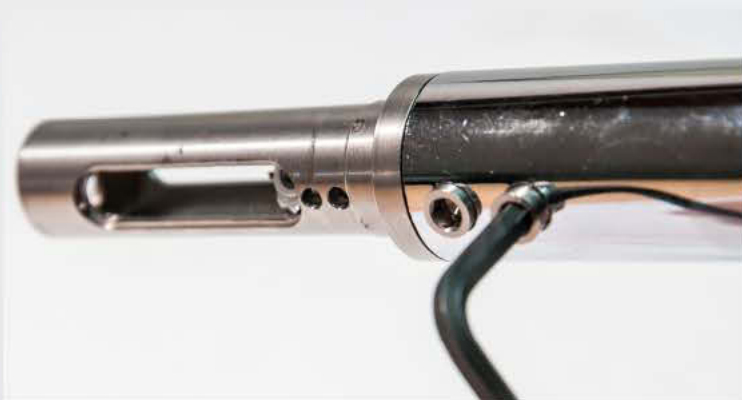
13 Das Griffstück wird mit dem Lenker verschraubt