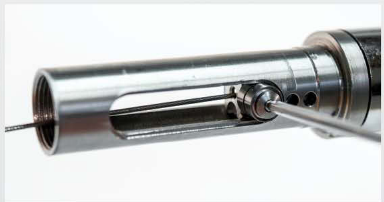
14 Sonderschraube mit Kugellagern und Distanzscheibe werden montiert