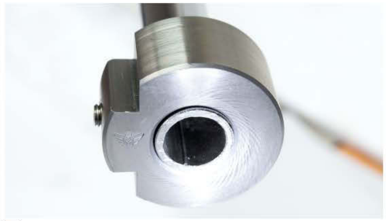
8 Mittels angefrästem Zapfen kann das Hilfsmittel in den Schraubstock gespannt werden