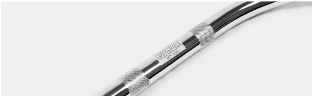
Art der Kennzeichnung