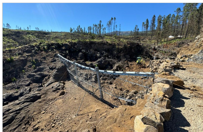
Barrera Debris Flow desde valle