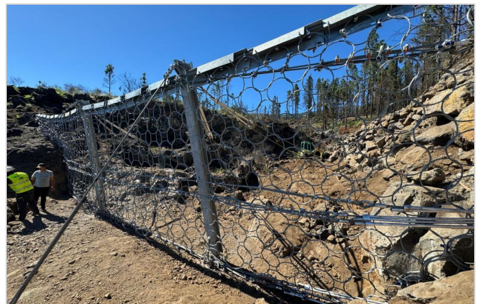
Detalle placas anti abrasión

Barrera Debris flow mediante cables de acero transversales y red de anillos Plano tipo