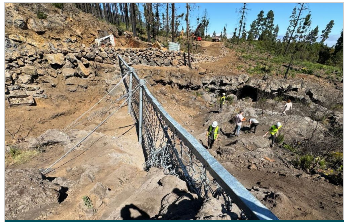
Vista superior de la barrera Debris Flow