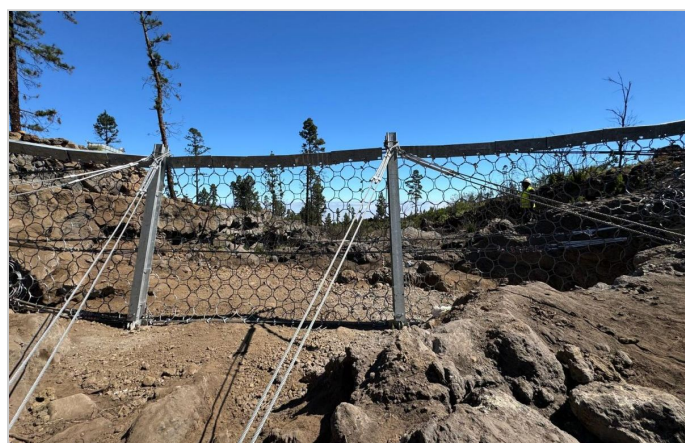
Cables a monte de la barrera