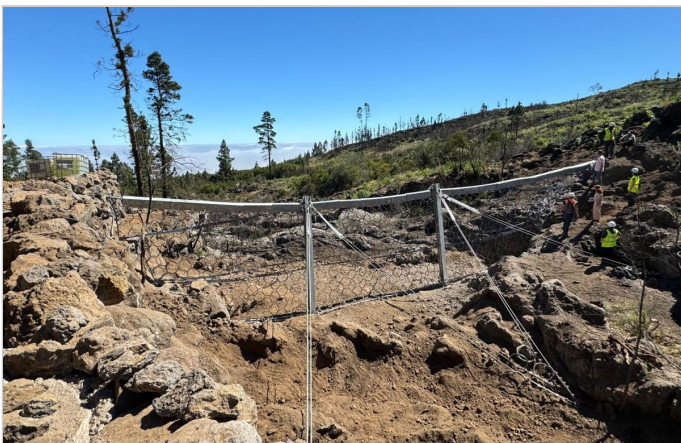
Barrera desde lado monte