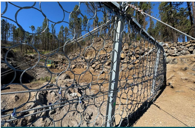
Unión entre cables y red de anillos