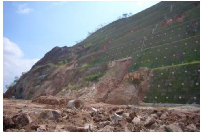
Antes de la Obra