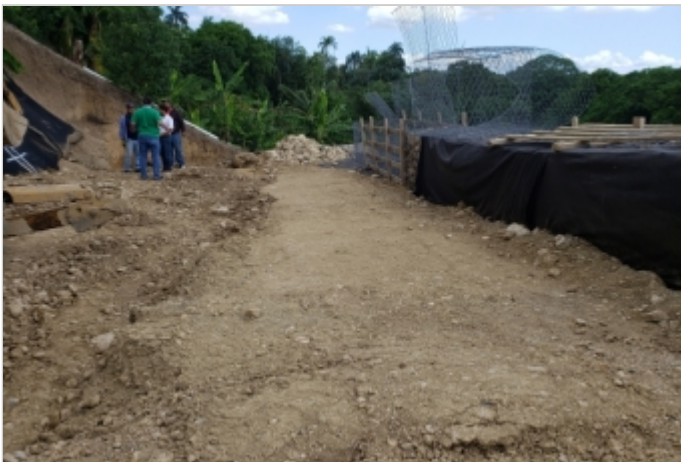
Antes de la Obra