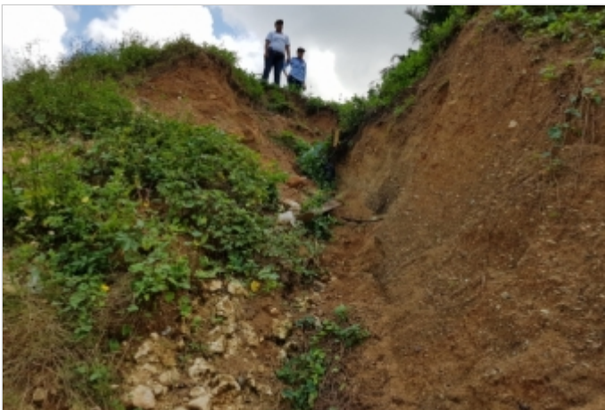
Antes de la Obra