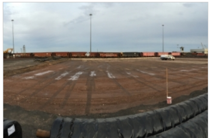
Antes de la Obra