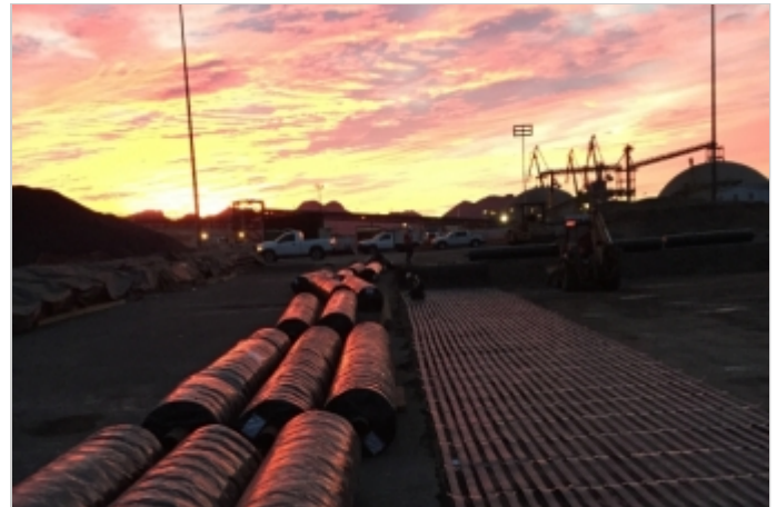
Antes de la Obra