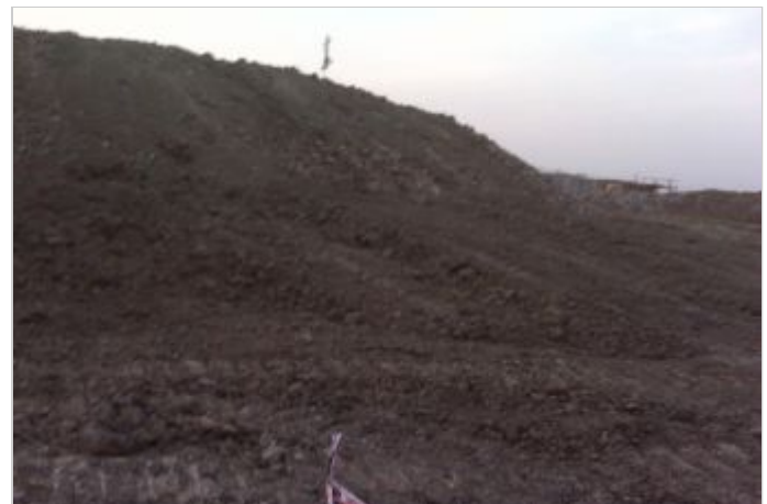
Antes de la Obra