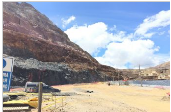
Antes de la Obra