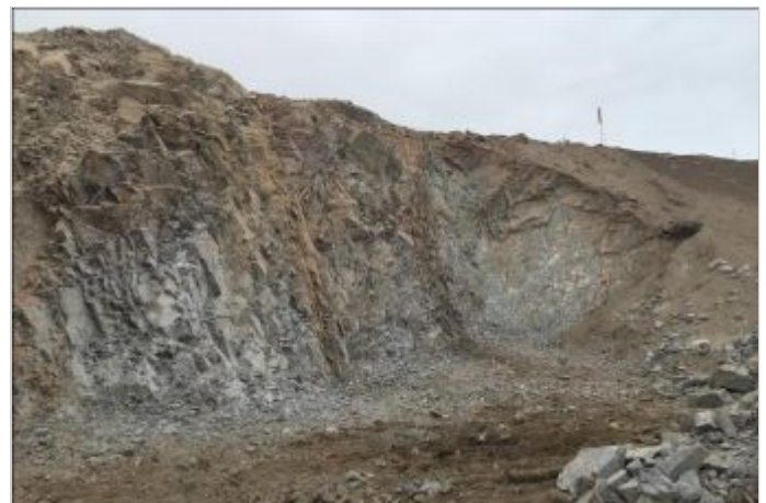
Antes de la Obra

A fin de crear la plataforma que conformará la vía y tratar de no invadir las propiedades privadas aledañas al proyecto, fue diseñada una solución con muros de suelo reforzado Terramesh® System, una de las causas para la adopción de la solución fue debido a la facilidad constructiva.