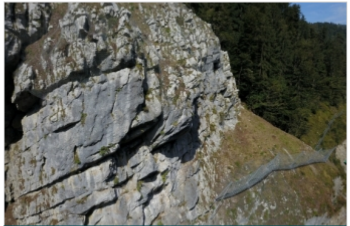
Počas výstavby 2018