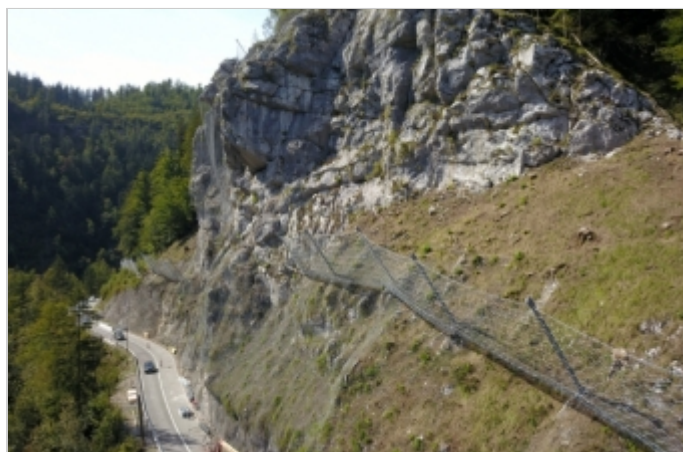
Počas výstavby 2018