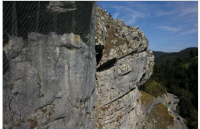
Počas výstavby 2018