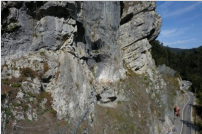
Počas výstavby 2018