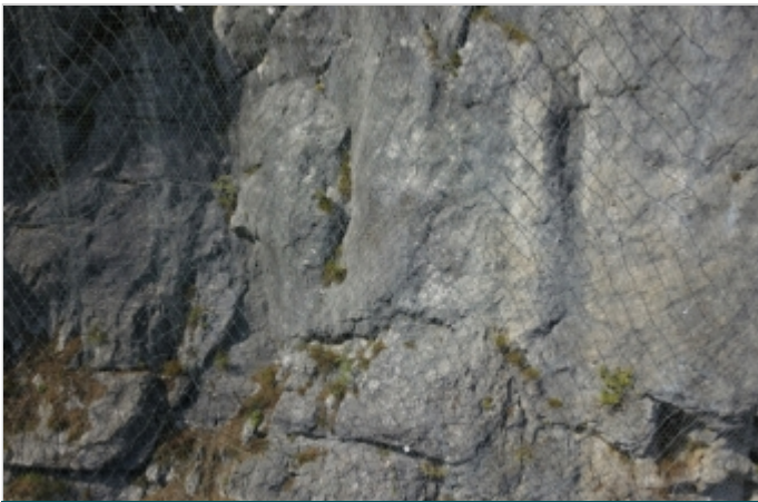
Počas výstavby 2018