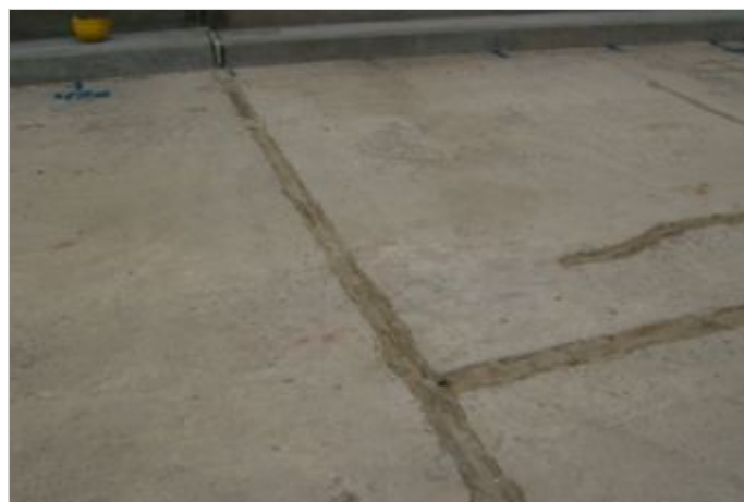
Antes da Obra

Foi recomendado a solução em geogrelha MacGrid® WG 50x50, combinada com a utilização do geotêxtil Não-tecido MacTex®. Essa solução é utilizada como reforço em pavimentações asfálticas ou aplicações em capas asfálticas sobre pavimentos de concretos já existentes. O MacTex®, saturado com asfalto, atua como uma membrana impermeável, evitando o bombeamento de finos enquanto o MacGrid® WG atua como elemento de reforço, evitando a propagação de fissuras na nova capa asfáltica. Foram aplicadas tiras de 50cm de largura dos dois produtos.