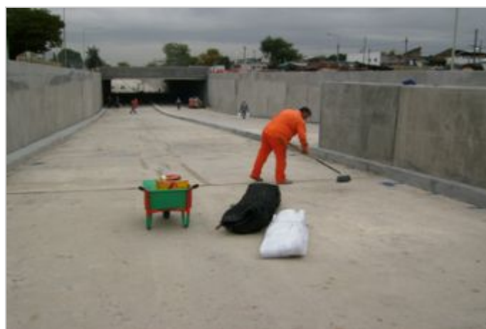
Durante a obra