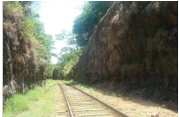
Antes de la Obra

Fueron instalados anclajes y placas de anclajes por todo el talud, justamente con redes de alta resistencia con la función de protección superficial. Los taludes fueron divididos en tres tramos: en el primero, compuesto por suelo, fue aplicada la malla SteelGrid® asociada a una biomanta de fibra de coco a fin de proteger y favorecer el talud contra la erosión y desarrollo de vegetación. El segundo y tercero, compuesto por un macizo rocoso con grados de inestabilidad, fueron protegidos con la malla SteelGrid® y con el HEA Panel, respectivamente.