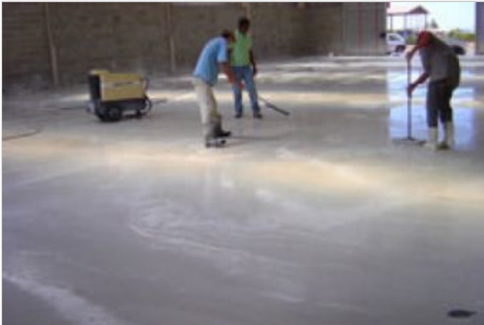
Durante a obra