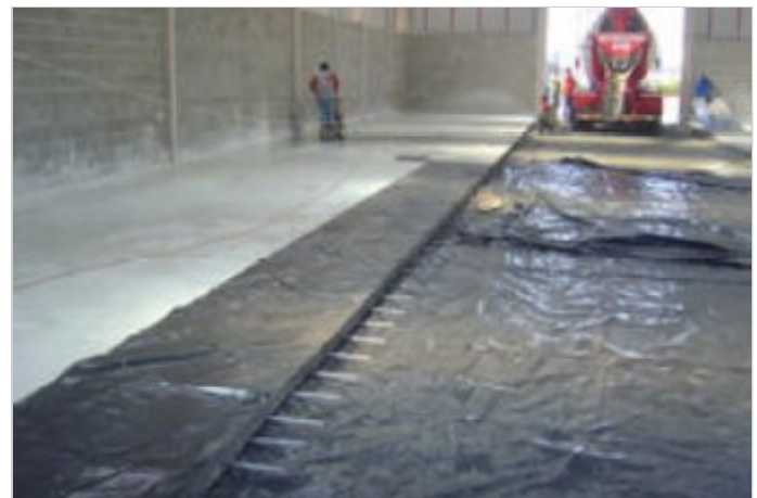
Antes da Obra