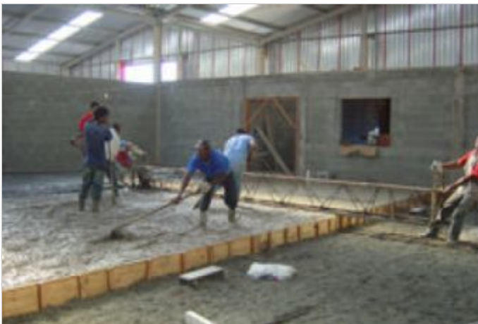
Durante a obra