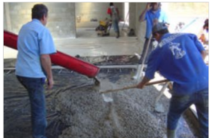
Durante a obra