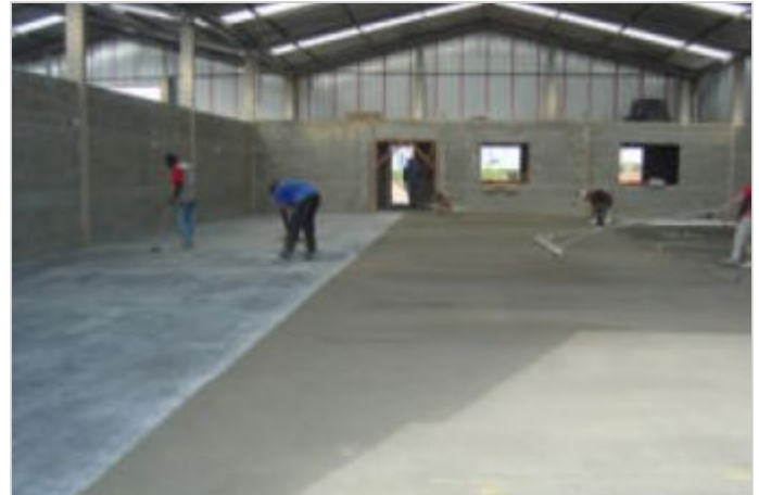
Durante a obra