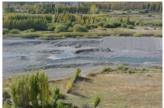
Antes de la Obra