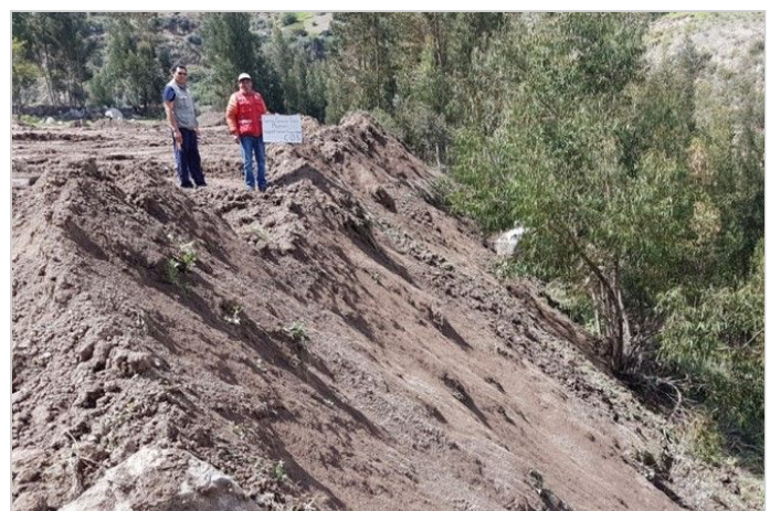
Antes de la Obra