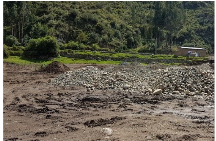
Antes de la Obra

El gran reto de realizar una propuesta de muro de suelo reforzado con una gran altura de 19 m. mediante la competitividad técnica-económica del sistema Terramesh® System como reemplazo al muro tradicional de concreto armado para la construcción de la plataforma del almacén. Para ello, se realizaron varios análisis de estabilidad en los muros de diferentes alturas con el fin de garantizar la estabilidad del muro en condiciones estáticas y pseudo, se obtuvieron los factores de seguridad favorables.